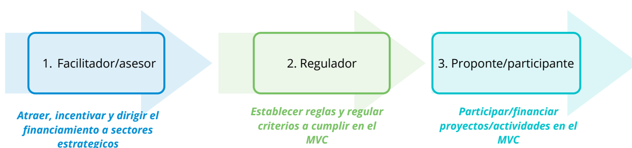
Figura 3 Roles que puede desempeñar Yucatán en el MVC

Con base en estos roles 8 , las acciones de Yucatán han sido categorizadas en función de sus objetivos, hacia quién está dirigido el apoyo, y sus competencias legales. La tabla 5 las enlista en tres categorías principales.